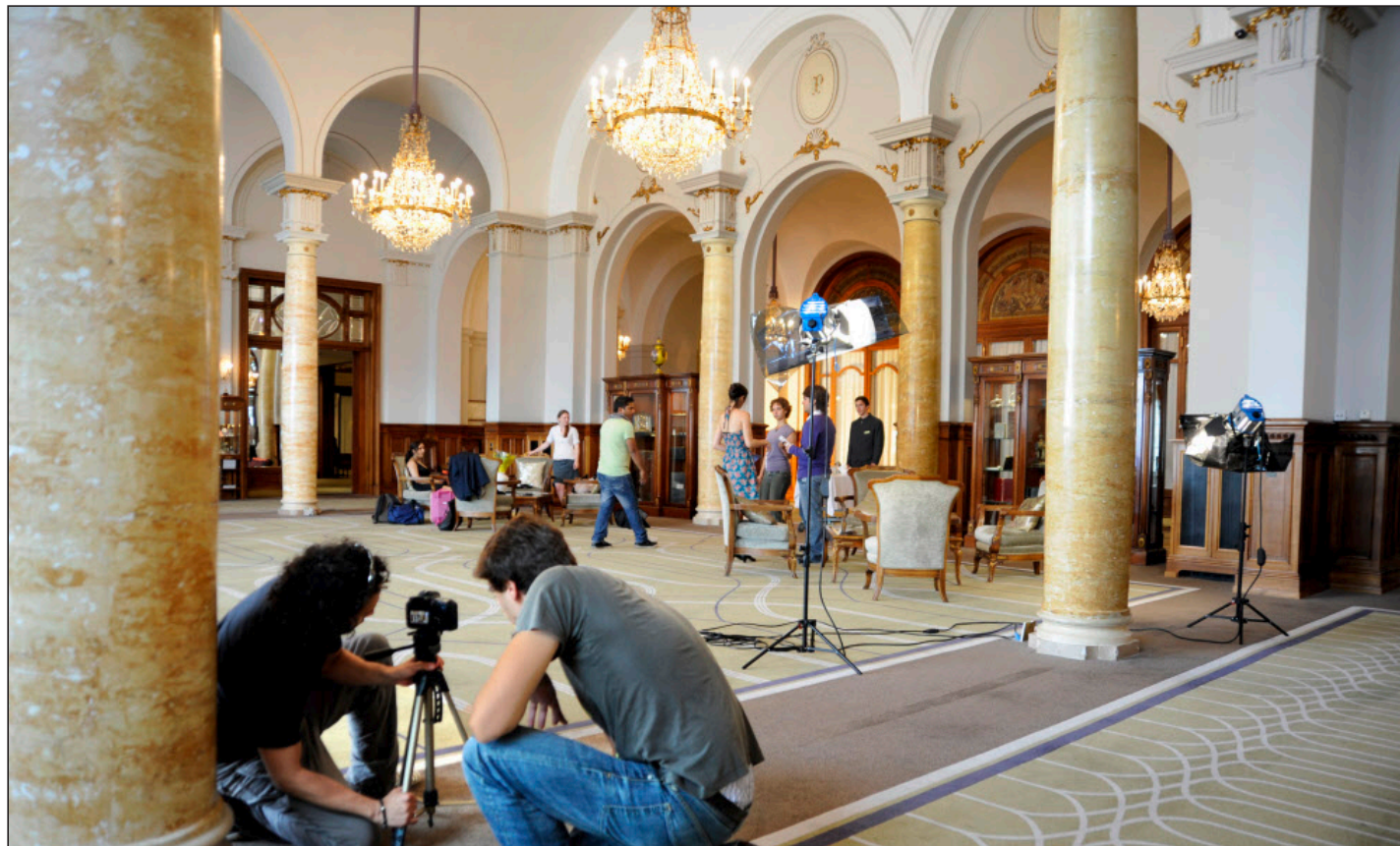
L'équipe d'Alejandro Gasser Daza (à gauche) a choisi le grand hall du Fairmont Le Montreux Palace pour des scènes du «Courrier silencieux».