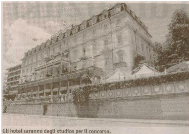
Gli hotel saranno degli studios per il concorso.

Il concorso si articolerà in due fasi: nella prima, i partecipanti hanno inoltrato entro il 2 aprile le loro idee cinematografiche via Internet. La giuria di esperti le valuterà e il 9 giugno 2009 renderà nota la nomination di venti progetti.